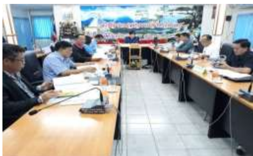
ภาพกิจกรรม : การอนุมัติเงินกองทุนพัฒนาสหกรณ์